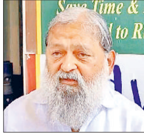
परिवहन मंत्री अनिल विज।

विर्जाबिलिटी कम होने पर अधिकतर दुर्घटनाएं होती हैं, इसलिए इन लाइटों से ड्राइवर्स को सुरक्षित ड्राइविंग में बड़ी सुविधा मिलेगी और सड़क सुरक्षा मजबूत होगी। इसी प्रकार, उन्होंने कहा कि राज्य सरकार ने नई ई-बसों का एक ओर ऑर्डर दिया है, जिनके आने से प्रदूषण कम होगा और ईंधन की खपत भी घटेगी। विज ने मीडिया कमिटी से बातचीत करते हुए कहा कि इन नई लाइटों का उद्देश्य अंधेरे और कोहरे में वाहन को अन्य चालकों के लिए विजिबल बनाना