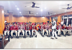
अंबाला। छात्रों को संबोधित करते वकता।