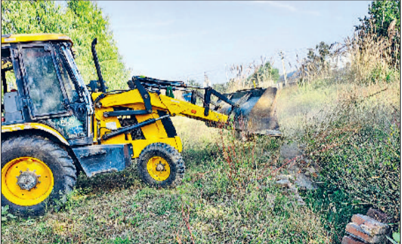
अवैध कॉलोनी भी मखमल मजरी मुनक रोड पर ही पाई गई, जिसका परिचा लगभग 4 एकड़ था। यहां भी सभी कच्ची सड़कों को पूरी तरह तोड़ दिया गया और अवैध डेवलपमेंट मिटा दी गई।

को ध्वस्त कर दिया गया। जिला नगर योजनाकार करनाल के ने बताया कि कोई भी व्यक्ति अवैध कॉलोनी या अवैध निर्माण करेगा तो उसके विरुद्ध सख्त कार्रवाई जारी रहेगी। अवैध विकास को बढ़ावा देने वाले व्यक्तियों को भी बख्खा नहीं जाएगा। जो भी व्यक्ति अवैध तरीके से प्लॉट बेच रहा है या विकास कर रहा है, उसके खिलाफ तुरंत एफआईआर दर्ज की जाएगी।