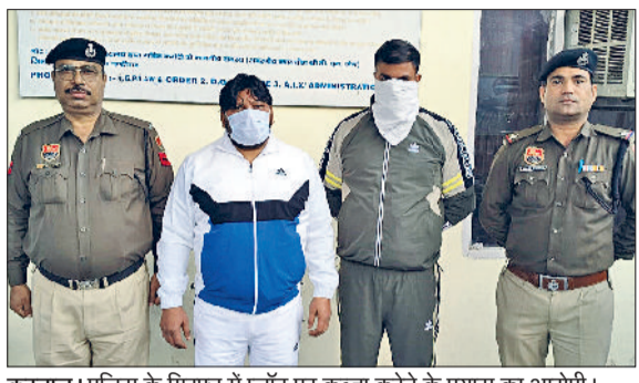
करनाल। पुलिस के गिरफ्त में प्लॉट पर कब्जा करने के प्रयास का आरोपी।