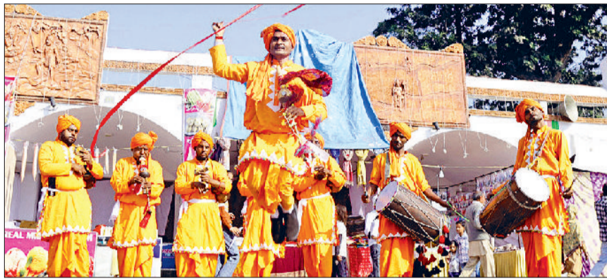
कुरुक्षेत्र। पर्यटकों का मनोरंजन करते सपेरा बीन पार्टी के कलाकार तथा वाद्य यंत्रों की प्रस्तुति देते कलाकार।

इस अनोखे संगम से ब्रह्मसरोवर की फिजा भी महक उठी है। यह महक देश के बहरीण और कोने-कोने तक पहुंच चुकी है और इस महक से रो जा ना हजारों लोग ब्रह्मसरोवर के तट पर खिंचे चले आ रहे हैं। अहम पहलू यह है कि अंतरराष्ट्रीय गीता महोत्सव के दौरान 48 कोस के 182 तीर्थों पर सांस्कृतिक कार्यक्रमों का आयोजन किया जा रहा है। अंतरराष्ट्रीय गीता महोत्सव-2025 के शिल्प और सरस मेले का चौथा दिन है और रोजाना पर्यटकों की संख्या में लगातार इजाफा हो रहा है। ब्रह्मसरोवर के घाटों पर उत्तर क्षेत्र सांस्कृतिक कला केन्द्र की तरफ से बेहतरीन कलाकारों द्वारा प्रस्तुतियां दी जा रही हैं। इन प्रस्तुतियों में किसी घाट पर पंजाबी संस्कृति, कहीं पर हरियाणवी और कहीं पर हिमाचल तो कहीं पर राजस्थान की लोक संस्कृति को देखने का अवसर मिल रहा है। इस लोक संस्कृति का आनंद लेने के साथ-साथ लोग ब्रह्मसरोवर के चारों तरफ