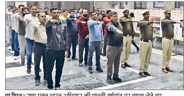
पानीपत। नशा मुक्त भारत अभियान की पांचवी वर्षगांठ पर शायथ लेते हुए अधिकारी व कर्मचारी।

कहा कि नशामुक्त केवल सरकारी अभियान नहीं, बल्कि सामाजिक जिम्मेदारी है। उन्होंने बताया कि नशा व्यक्ति की सेहत और शिक्षा दोनों को नुकसान पहुंचाता है। उन्होंने कहा कि बिना नशे की जीवन में आत्मविश्वास, स्वास्थ्य और खुशहाली स्वतः बढ़ती है। नशे की लत देश व समाज की तरक्की में