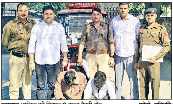
करनाल। पुलिस की गिरफ्त में वाहन बैटरी चोर।

वारदात में प्रयुक्त सामान और अवैध गतिविधि से जुड़े तथ्यों का पता लगाएगी।