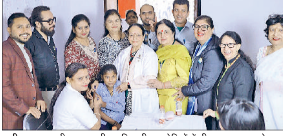
पानीपत। इनर व्हील क्लब की पादाधिकारीगण, बेटियों में टीकाकरण करवाते हुए।